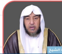
فضيلة الشيخ د. سامي بن محمد الصقيير