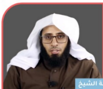
فضيلة الشيخ عبدالله بن حسن الحارثي