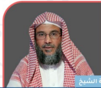
فضيلة الشيخ د. عبدالله بن صالح الكهمل