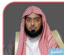
فضيلة الشيخ د. ماضي بن عبيد الشمري