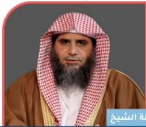
فضيلة الشيخ د. فهد بن سليمان الفهيد