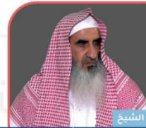
فضيلة الشيخ محمد بن عبدالله المعيوف