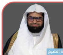
فضيلة الشيخ د. إبراهيم بن عبدالكريم السلوم